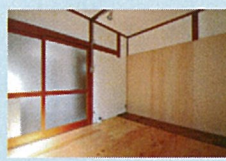
壁面に有孔ボード