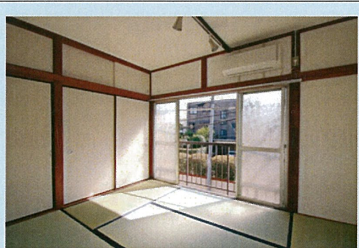
室内日当たり良好

備考 ・賃料47,000円/月 ・管理費1,000円/月 ・保険15,000円/2年間 ・保証会社審査あり ・別途駐車場有 6,000円/月